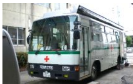
中小田井学区献血グループ 中小田井学区保健委員会