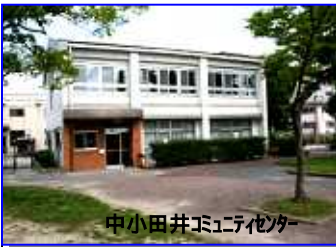
中小田井コミュニティセンター