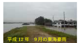
平成 12 年 9 月の東海豪雨

今回のゲリラ豪雨による被害は、内水氾濫によるもので、当中小田井学区は東海豪雨以後の治水事業により、特に貯留管築造の威力が発揮されました。